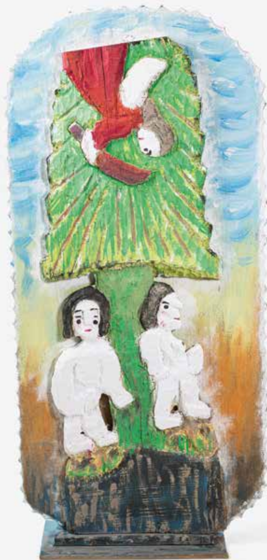
Dionizy Purta, Wygnanie z Raju