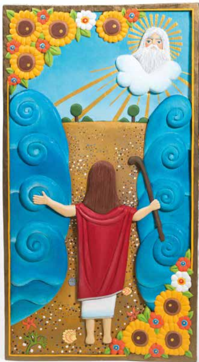
Dorota Stanicka, Przejście przez Morze Czerwone