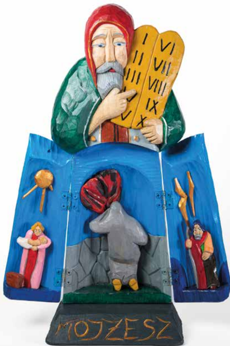
III NAGRODA | Leszek Baczkowski, Mojżesz