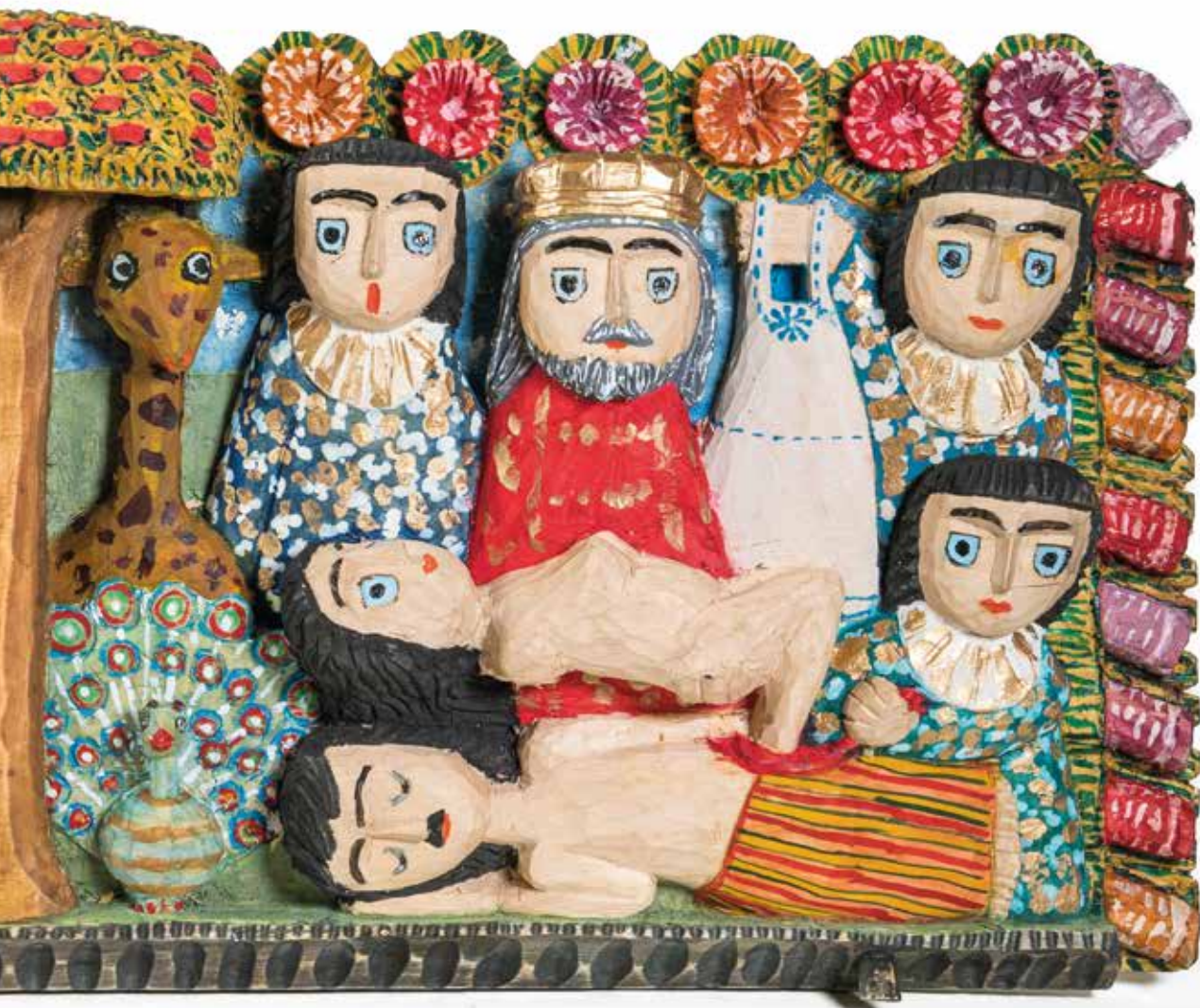
II NAGRODA | Antoni Kamiński, Stworzenie Adama i Ewy