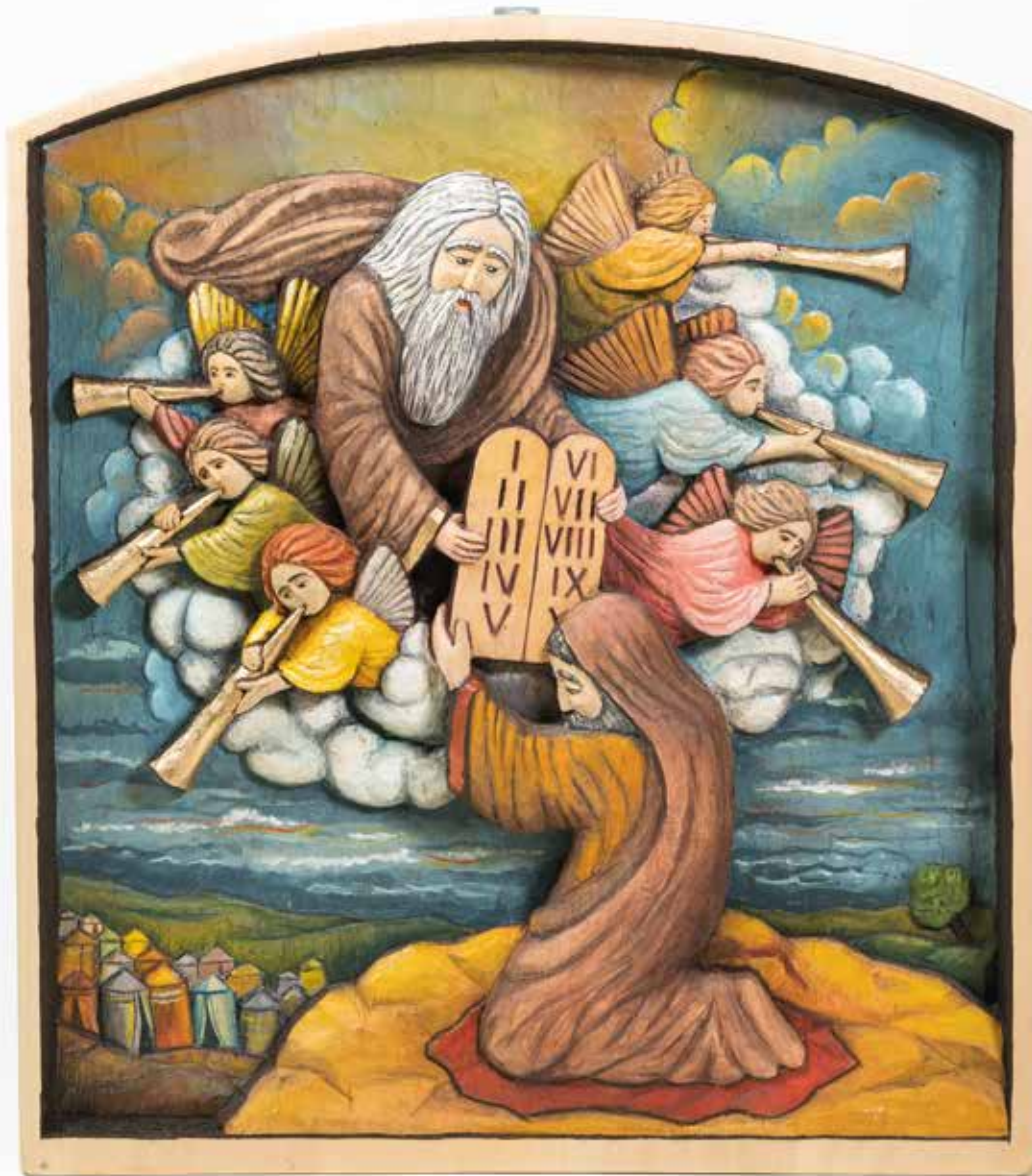
WYRÓŻNIENIE | Bolesław Parasion, Mojżesz przyjmuje dziesięć przykazań