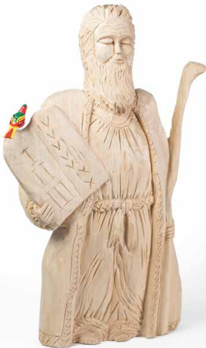
Piotr Mentel, Mojżesz